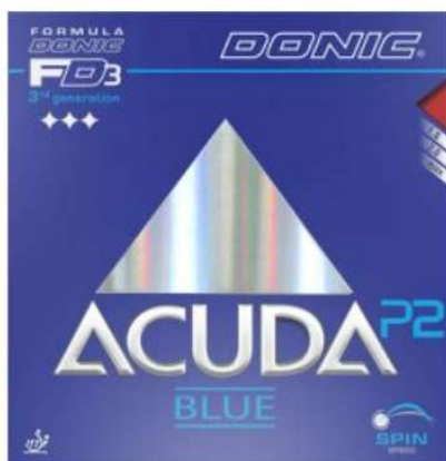
DONIC "Acuda Blue P2"

Pour un revêtement avec plus de contrôle mais toujours offensif, l'Acuda P2 sera très bien