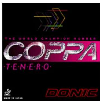
DONIC "Coppa Tenero"

Le COPPA TENERO est un parfait exemple de revêtement qui convient à tout type de joueurs